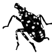
JEUNE LARVE AVRIL - JUIL