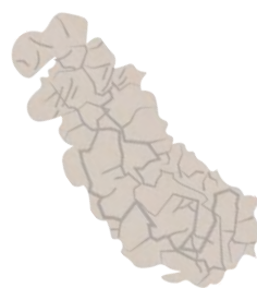
ŒUFS SEPT - AVRIL

Le fulgore tacheté (FT; Lycorma delicatula ) est un insecte envahissant en provenance d'Asie qui tue les plantes en se nourrissant de leur sève. Le FT se nourrit en essaims sur plus de 70 espèces d'arbres et de plantes telles que les vignes, les arbres fruitiers, le noyer noir, les érables et les chênes. Le FT est une menace pour la production canadienne de vin et de fruits et pour les milliards de dollars qu'elle génère.