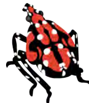
LARVE PLUS ÂGÉE JUIL - SEPT