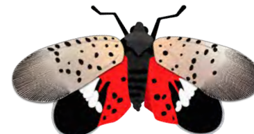
ADULTE JUIL - DÉC